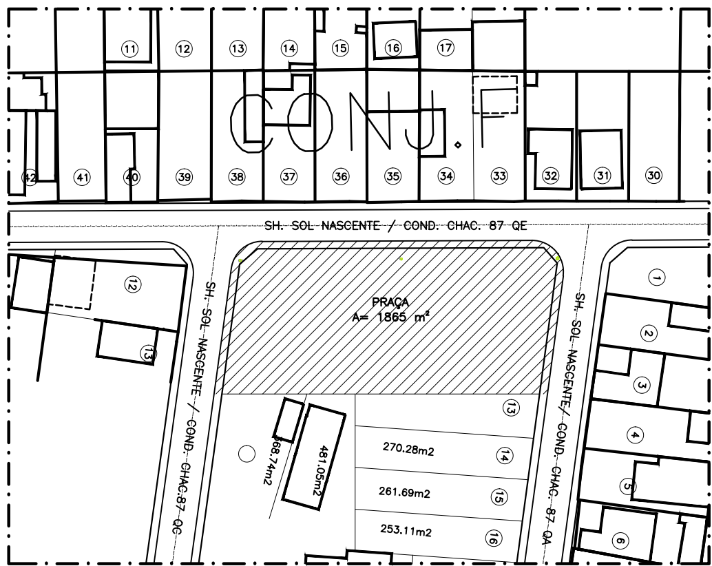
PLANTA SITUAÇÃO Escala: 1:1000 ÁREA DA PRAÇA: 155,87 m² ÁREA TOTAL: 211,7340 m²